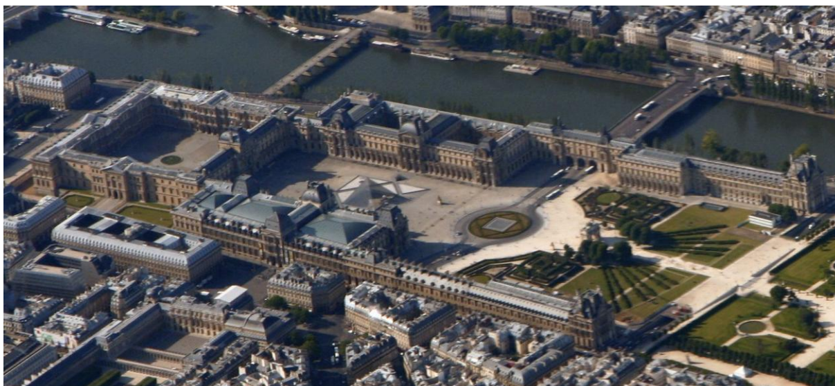
Vue Aérienne du Louvre actuel

Dans le cadre de son projet de « grands travaux », François Mitterrand fera réaliser la Pyramide, qui abrite la nouvelle entrée du Musée, et transférer à Bercy le Ministère des Finances qui occupait encore une aile sud du Louvre. Le « Grand Louvre » actuel était né, l'un des plus importants musées du monde.