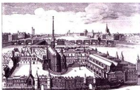
Palais Royal de la Cité au XIV e siècle

Ce n'est qu'au XIV e siècle que Charles V décidera d'en faire la résidence royale, l'insérant définitivement à l'intérieur de la ville, sur la rive droite de la Seine où se développait désormais la capitale. Il y fera également aménager la première bibliothèque royale. En conséquence, le Palais de la Cité (aujourd'hui « Conciergerie »), perdra alors son rang de résidence royale pour n'abriter que des services administratifs (palais de justice, imprimeries, etc.). Mais les événements politiques conduiront Charles V et ses successeurs, à s'établir hors de Paris.