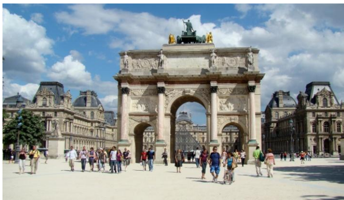
Le Louvre vu de l'Arc de Triomphe du Carrousel

Tant Napoléon Bonaparte que Napoléon III , poursuivant le « Grand Dessein » d'Henri IV, participeront à la poursuite de son agrandissement jusqu'à obtenir un espace fermé entre le Louvre et le Palais des Tuileries. Mais les émeutiers de la Commune incendièrent ce dernier qui ne fut jamais reconstruit, laissant ainsi le Louvre ouvert sur le jardin des Tuileries. Seul l' arc de Triomphe du Carrousel , qui en symbolisait l'accès, a été conservé.